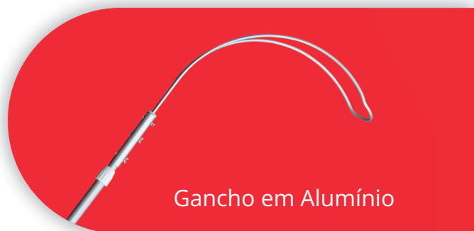
Gancho em Alumínio