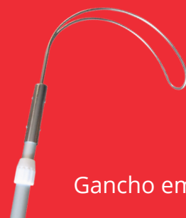
Gancho em Aço Inox